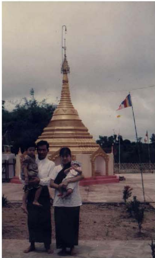
ပရိဘောဂစေတီတော်နှင့် ဘုရားဒါယကာ မိသားစု