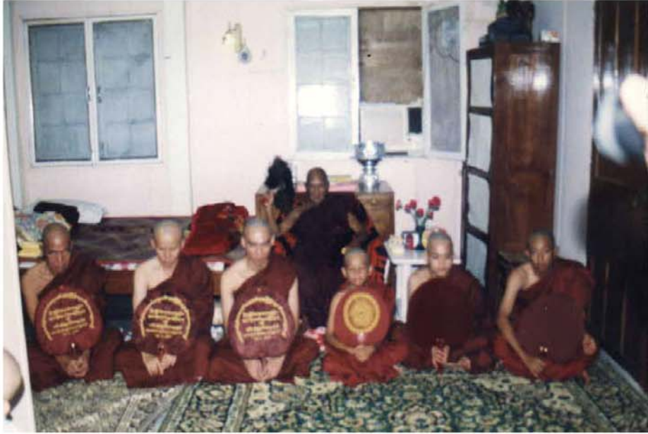
စာရေးသူ၏အိမ် (အလုံ) ၌ ပါးအလှူနှင့် ရဟန်းခံ ရှင်ပြုပုံ