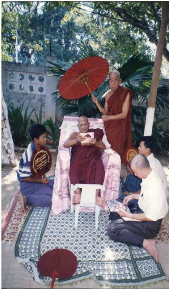
မနက်ခင်း အလုံအိမ်ခြံဝင်း၌ ဆားတောင်ဆရာတော်တုရားကြီး ခေတ္တသီတင်းသုံးခဉ်