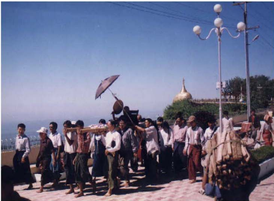
ဆားတောင်ဆရာတော်ဘုရားကြီး ကျိုက်ထီးရိုးဘုရားမှ ပြန်ကြွစဉ်