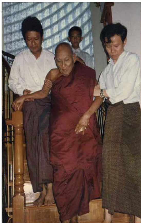
ဆားတောင်ဆရာတော် ဘုရားကြီး ဗိုလ်မှူးကြီးကိုကိုမောင် နေအိမ်မှ ဆေးခန်းသို့ကြွစဉ်