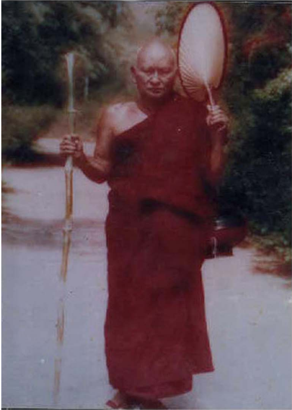
ဆားတောင်ဆရာတော်ဘုရားကြီး၏ ပုံတော်