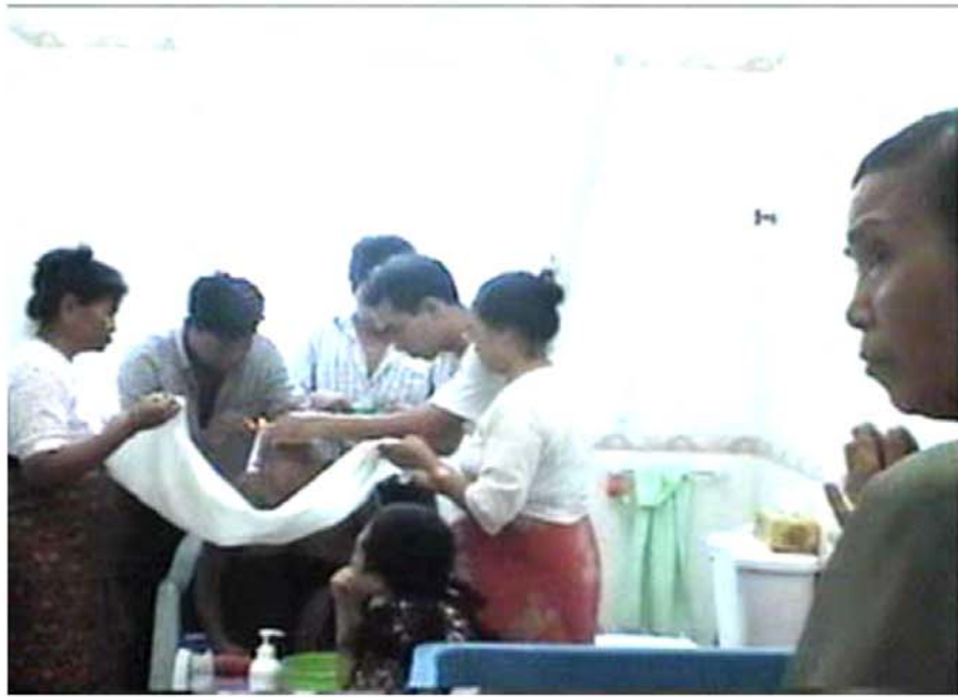
ဆားတောင်ဆရာတော်ဘုရားကြီး မာလာဂနိုင်ဟေမာမြိုင်အိမ်၌ ဆံချနေပုံ