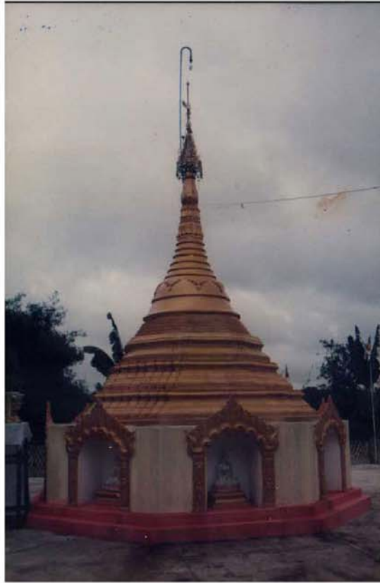
ဆားတောင်ဆရာတော်ဘုရားကြီး၏ ပရိဘောဂစေတီတော်