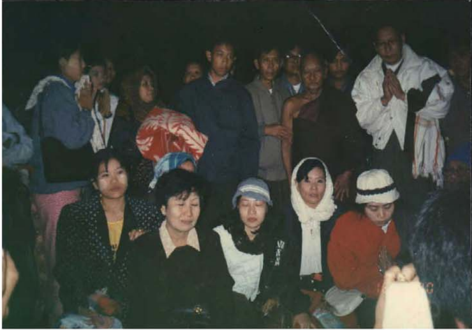
ဆားတောင်ဆရာတော်ဘုရားကြီး တပည့်ဒါယကာ၊ ဒါယိကာမများနှင့်အတူ ကျိုက်ထီးရိုးဘုရားဖူးစဉ်