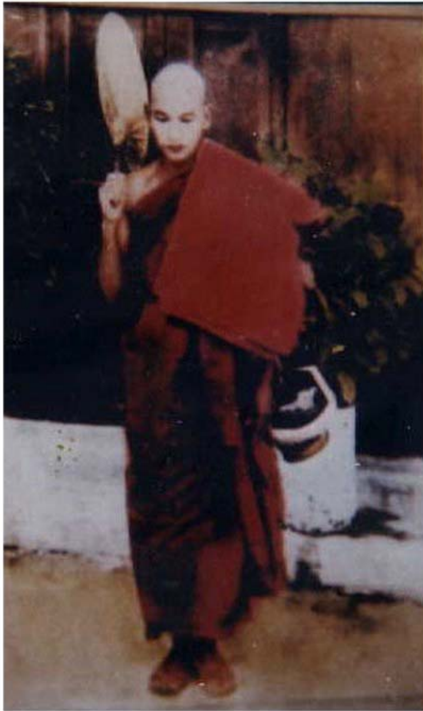
ဆားတောင်ဆရာတော်ဘုရားကြီး၏ သက်တော် (၃၀)နှစ်အရွယ်ပုံတော် ရဟန်းကိစ္စပြီးချိန်