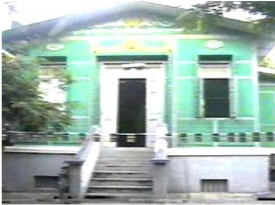
ရန်ကင်းတောင်သိမ်တော်ပုံ