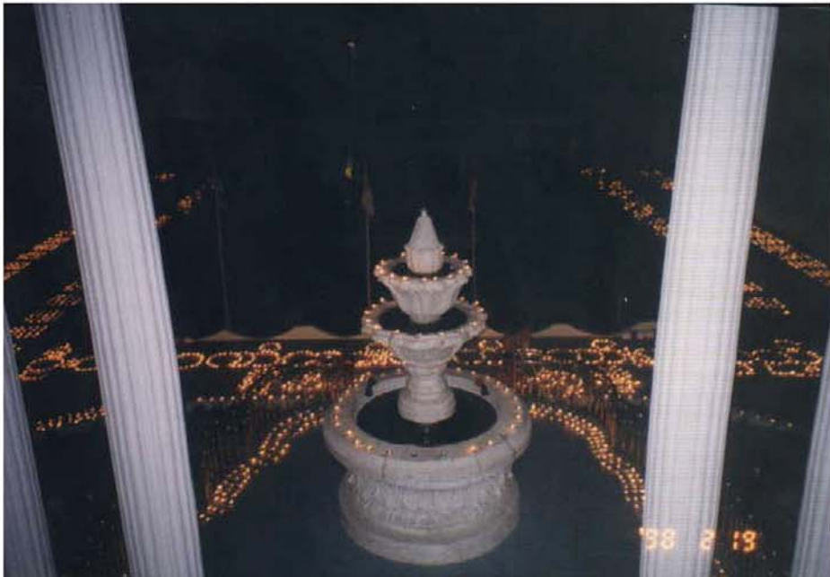
မာလာဂနိုင်းဟေမာမြိုင်အိမ်ရှေ့တွင် ဆားတောင်ဆရာတော်ဘုရားကြီး ကြွရောက်ပူဇော်ခံစဉ် ဆီမီး (၈၀၀၀) ပူဇော်ပုံ