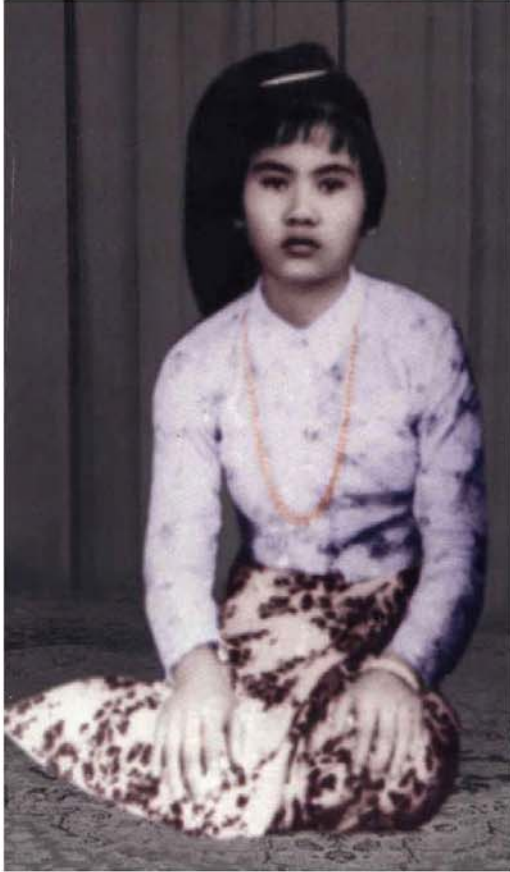
ရဟန်းအမ ကျောင်းအမကြီး ဒေါ်အေးမယ် အသက် (၁၈)နှစ်အရွယ်ပုံ