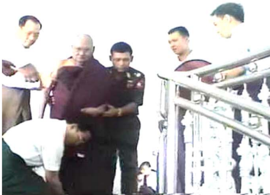
ဆားတောင်ဆရာတော်ဘုရားကြီး စာရေးသူအိမ်မှပြန်ကြွခဉ်