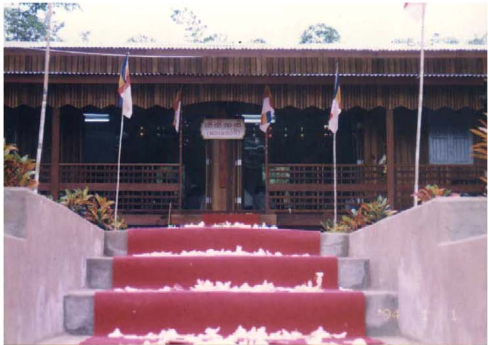
ကျောင်းဒါယကာ ဦးကျော်ဆွေ လှူဒါန်းထားသည့် ဆားတောင်ဆရာတော်ဘုရားကြီး သီတင်းသုံးရန်ကျောင်း