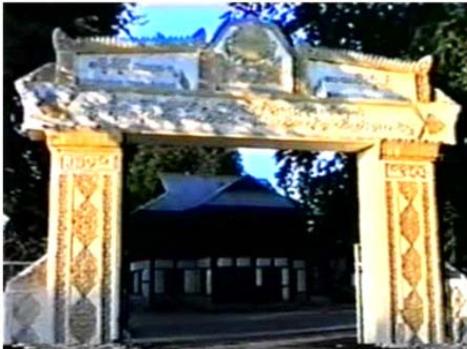
မစိုးရိမ်တောရ ဓာသင်တိုက်