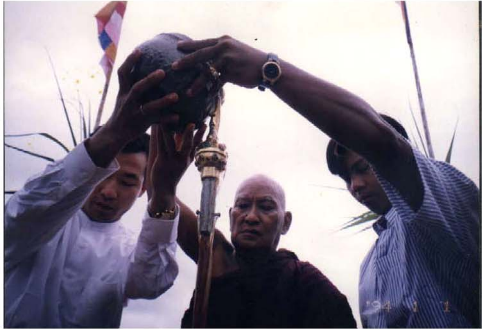
ပရိဘောဂစေတီ ထီးတော်တင်ပွဲတွင် ဆားတောင်ဆရာတော်ဘုရားကြီးနှင့် စာရေးသူ၏သား ဘုရားဒါယကာ ဦးကျော်ဆွေတို့ ရေစင်သွန်းလောင်း ပူဇော်နေပုံ