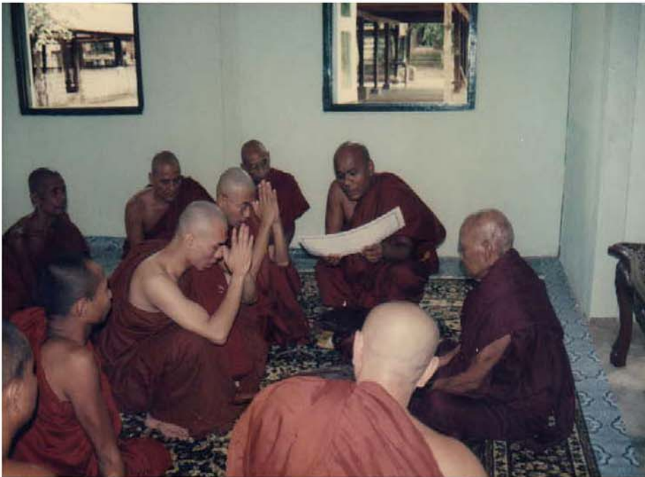
ဆားတောင်ဆရာတော်ဘုရားကြီးအား ဥပဇ္ဈာယ်ပြု၍ စာရေးသူ၏ သားနှစ်ယောက် ရဟန်းအဖြစ်ခံယူနေပုံ