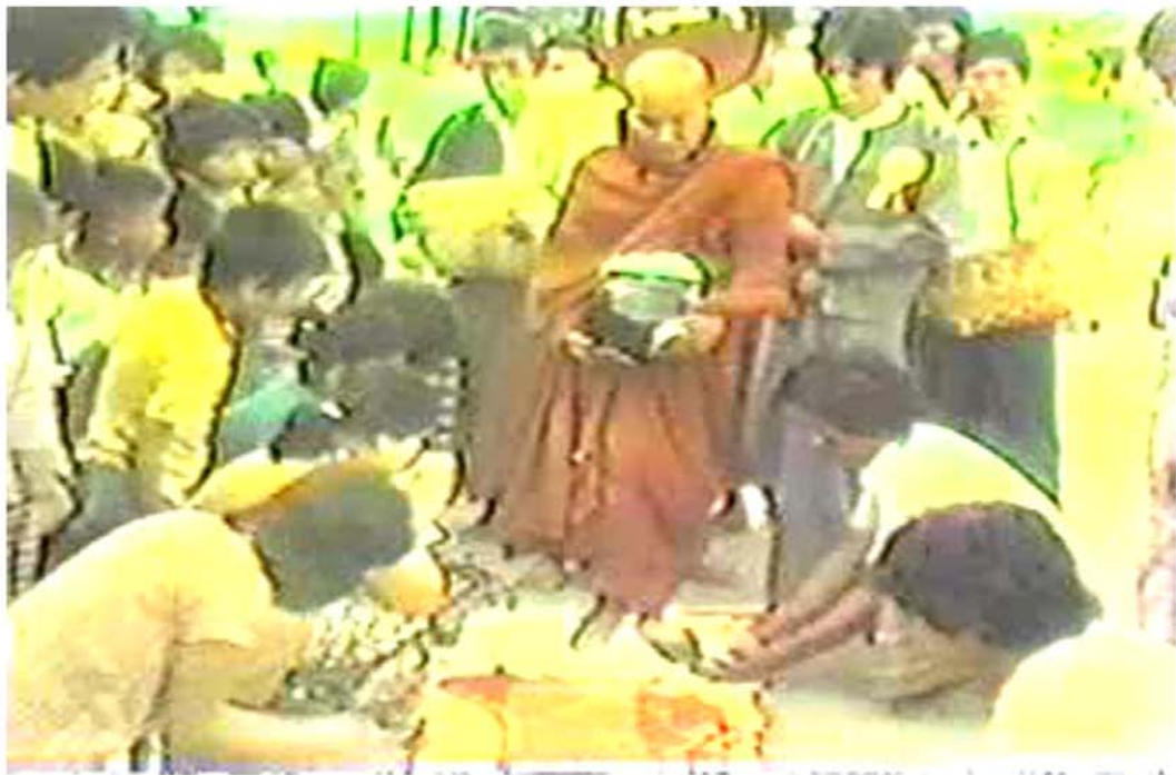
၁-၉-၁၉၈၅ နေ့ မန္တလေးတိုင်းတွင် ဆွမ်းဆန်ခိမ်း လောင်းလှူပွဲကြွစဉ်