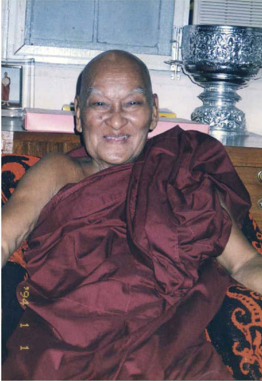
ဆားတောင်ဆရာတော်တုရားကြီး၏ပုံတော်