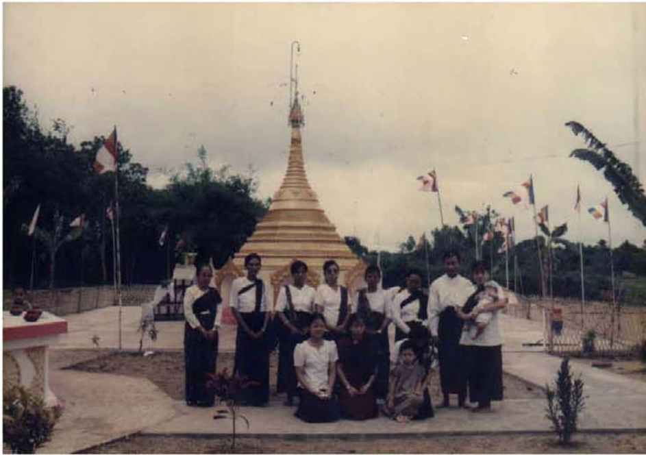
ပရိဘောဂစေတီတော်၊ ရဟန်းအစ်မ မိသားစုနှင့် ဘုရားဒါယကာ၊ ဒါယိကာမ မိသားစု