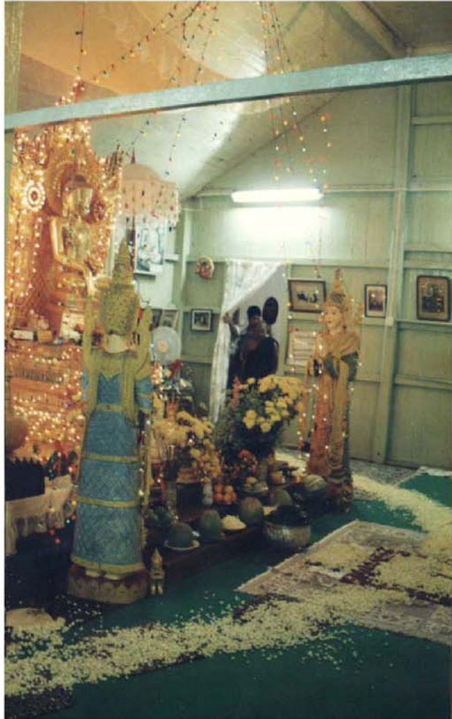
စာရေးသူ၏အိမ် (အလုံ)၌ ဆားတောင်ဆရာတော်ဘုရားကြီး ဘုရားဝတ်ပြုရန်ထွက်လာခဉ်