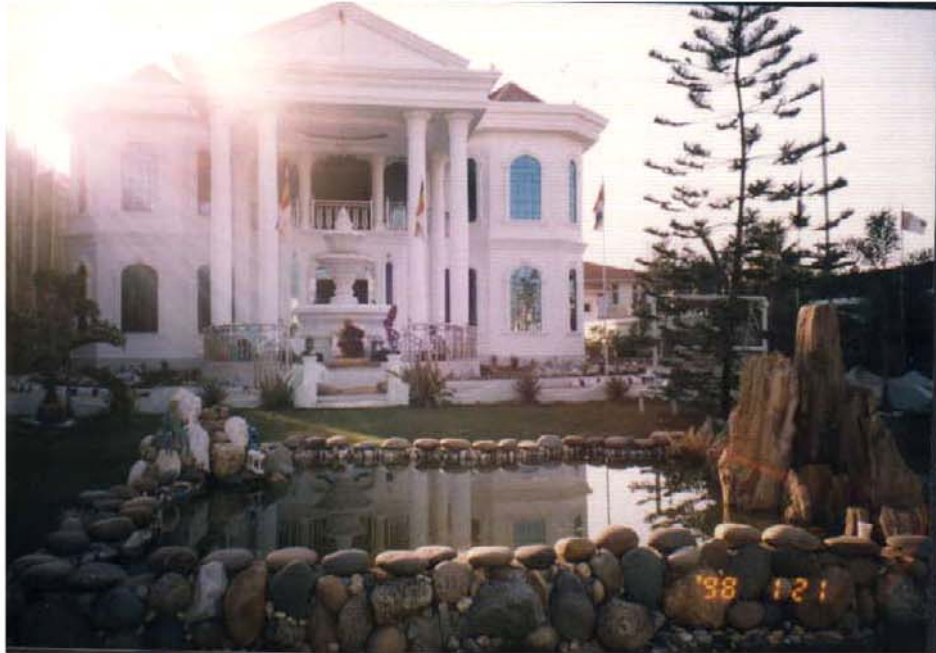
မာလာဂနိုင်းဟေမာမြိုင်အိမ်ရှေ့တွင် ဆားတောင်ဆရာတော်ဘုရားကြီး သီတင်းသုံးနေစဉ်ပုံ