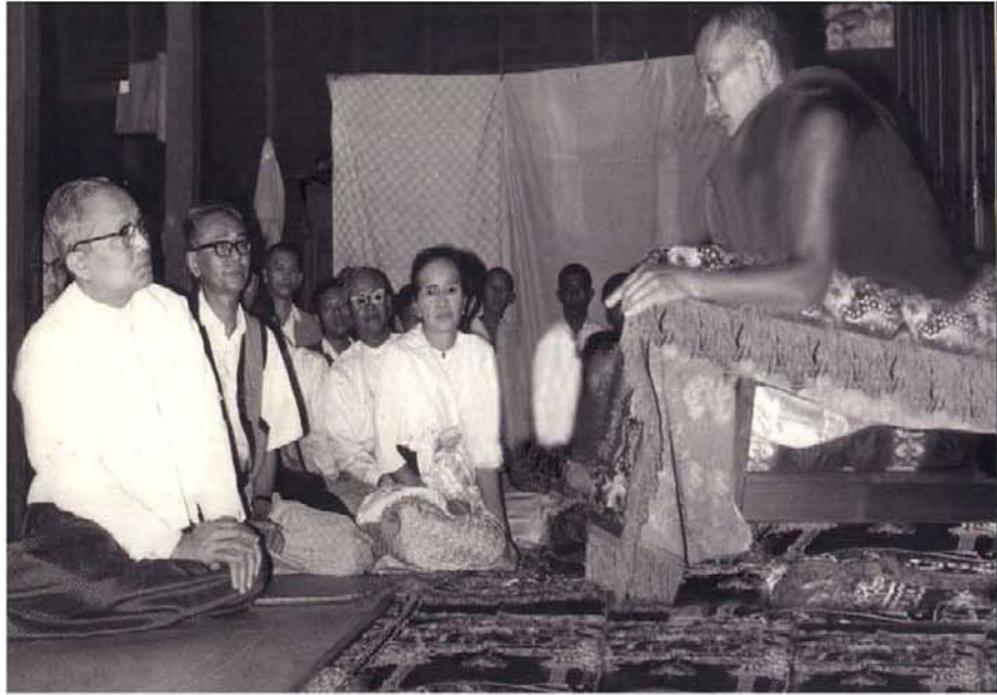
ကုလသမဂ္ဂအတွင်းရေးမှူးချုပ်ဦးသန့် နှင့်စာရေးဆရာမကြီး ဒေါ်ခင်မျိုးချစ်တို့ ဆရာတော်ထံမှ သြဝါဒခံယူနေပုံ