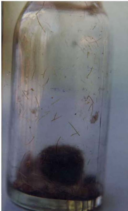
ဆားတောင်ဆရာတော်ဘူရားကြီး၏ဆံတော်လှီးနေပုံ