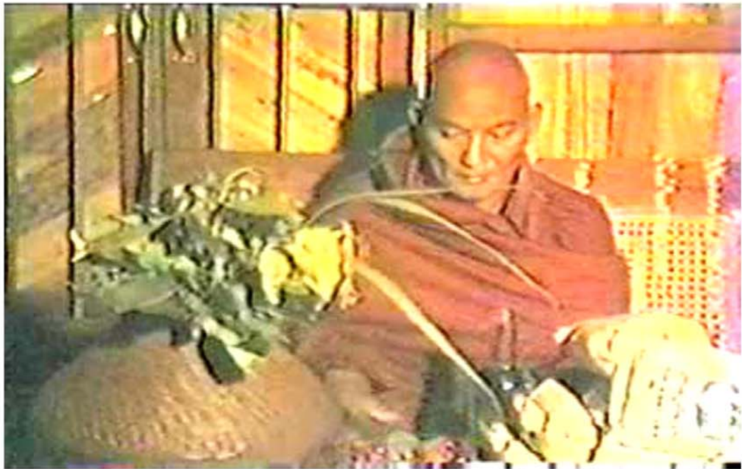
၁-၉-၁၉၈၅ နေ့ မန္တလေးတိုင်းတွင် ဆွမ်းဆန်ခိမ်းကြွပြီး ပရိတ်တရားတော်များချီးမြှင့်နေပုံ