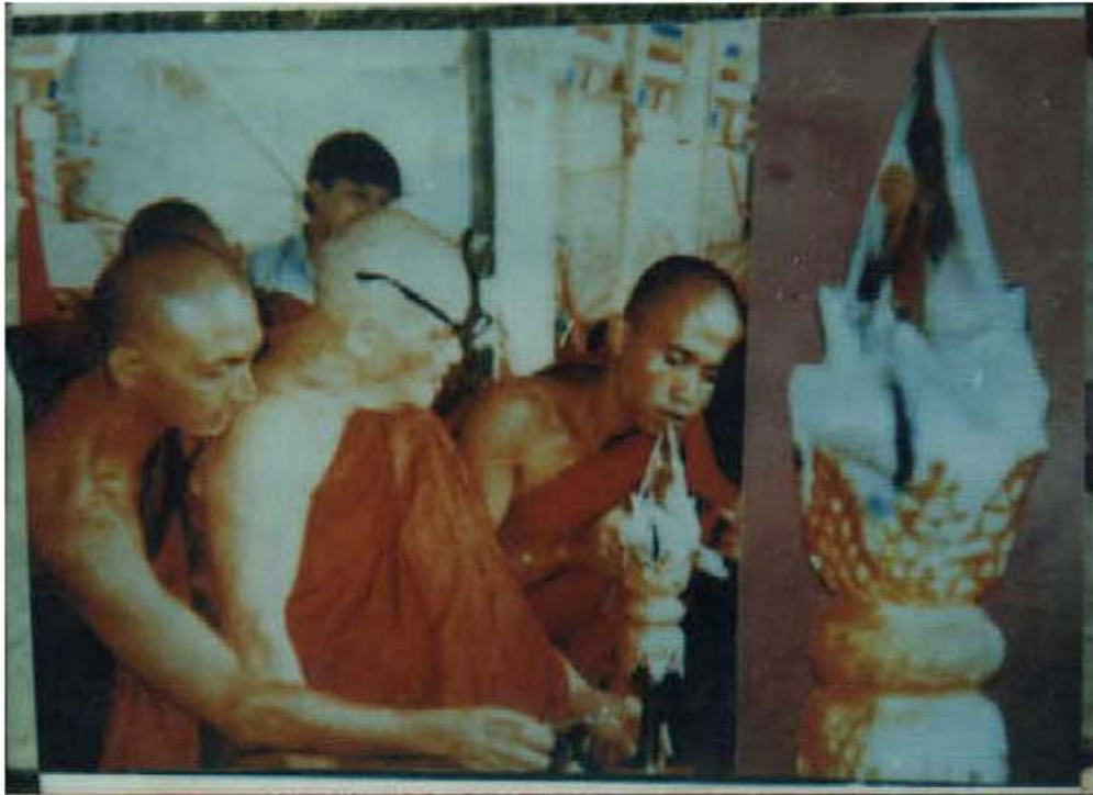
စိန်ဖူးတော်ထဲတွင် ဆားတောင်ဆရာတော်ဘုရားကြီး ကြွလာသည့်ပုံ ထင်ရှားစွာပေါ်နေသည်ကို ကုံလုံဆရာတော်ဘုရားကြီးမှ ပြသနေပုံ